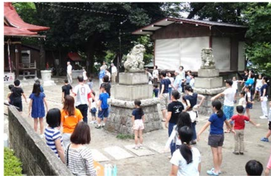
松が丘北野神社 ラジオ体操