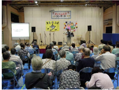
コンサートでのアコーディオン演奏

午前10時〜午後2時 童謡、オカリナ演奏、アコーディオン演奏、ハワイアン演奏、フラダンス、着物リフォームファッションショー、野方警察署からのお話しなど(予定)