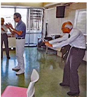
ことぶきえこの実にて