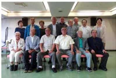
6月21日 第6回定期総会にて