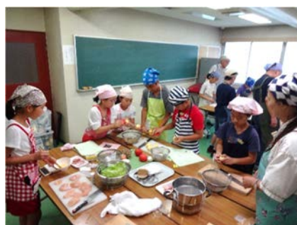
子どもの料理教室(前回の様子)

■平成31年度いきいき健康体操・シニアヨガ・フラダンスの前期(4～9月分) 参加者募集