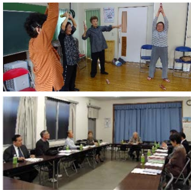
上：ダンベル体操 下：町会長会議

センター閉館中の地域活動は近隣公共施設の他、地域の皆さんのご協力で以下の場所でも開催しています。コロー中野、江古田三丁目アパート、松が丘片山会館、江古田一丁目町会会館、旭公民館、須賀稻荷社務所、えごたいえ(順不同)