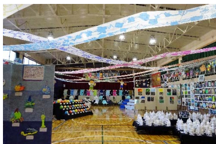
展覧会 (江原小学校)