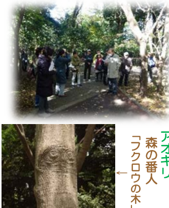
アオキリ 森の番人 「フクロウの木」

11月30日(土)、中野で一番大きい江古田の森公園で開催しました。参加者のアンケートでは、「江古田の森の深さがわかり、より愛着がわきました」など身近な公園を知ることなど新しい発見が生まれました。