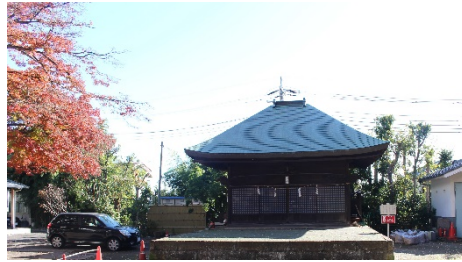
現在の神楽殿 令和元年12月撮影

かりで描いたらしく、「弘化四年夏」の年号が入っている。昭和五十六年十二月、近火により罹災、焼失はまぬがれたものの、画も水をかぶり、かなり色あせてしまったのは残念であった。翌年九月には銅葺きの屋根で復元改築された。