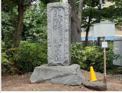
史蹟江古田原沼袋古戦場碑 令和2年6月撮影

史実によると文明九年四月十三日、上杉定正の臣、江戸城主太田道灌は、関東管領上杉顕定及び定正を襲って敗走せしめた長尾景春の党、豊島泰明を