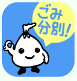
ごみのん 中野区減量キャラクター

びん・缶・ペットボトル 12月31日(木)～1月3日(日) 【問合せ】ごみゼロ推進課 ☎(32228)5555