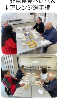
非常食食べ比べ＆ アレンジ選手権