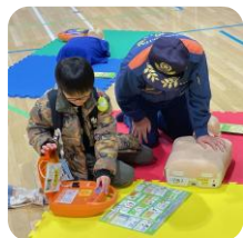
↑江原町2丁目 ショッピング通り 防災フェアAED体験 （レクホール）