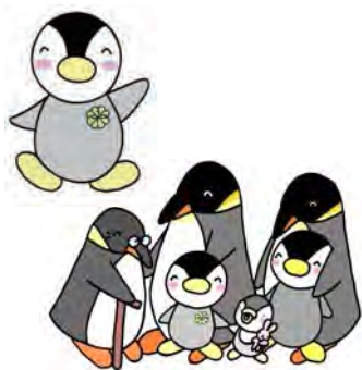
東京都民生委員・児童委員キャラクター「ミンジー」