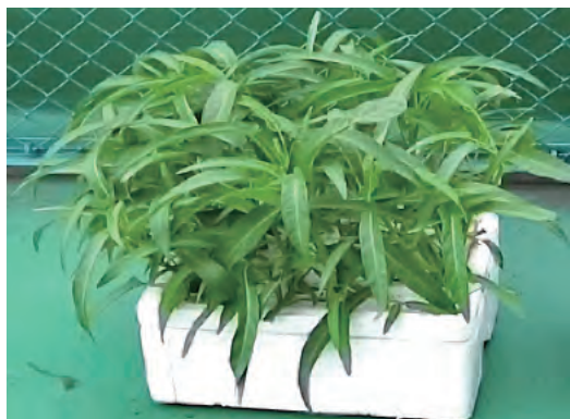
たくさん採れた「きず菜ちゃん」(空芯菜)