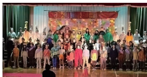
昨年11月の学芸会 4年生「ライオンキング」都連合学芸会にも出演しました。

【所在地】江原町1-39-1 昭和27年開校 14学級(特別支援学級1学級) 児童431名